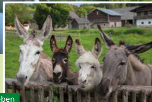
Viele Tiere beleben das Dorf